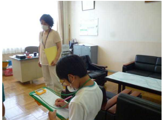
「校長室で校長先生に会ったよ。」