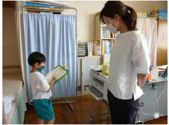
「保健室に、いろいろなものがあるぞ。」

オリエンテーリング、1階、2階、3階と、4回に分けた学校探検が終わりました。子供たちは、3階からの景色を楽しんだり理科準備室の人体模型に驚いたりしながら意欲的に探検をしていました。探検を重ねることで、1年教室にあるものと比べたり数を数えたりするようになり、探検の仕方も上手になりました。今後は、気になる場所を再度探検し、見つけたものや思ったことを家の人に知らせるための「新聞」を作りたいと思います。